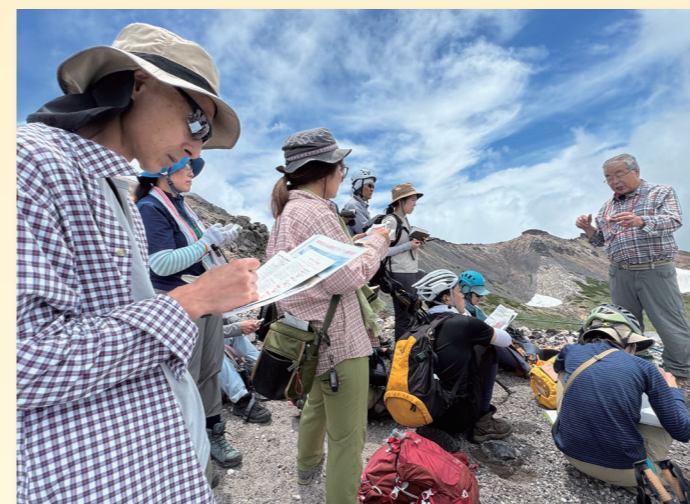
理科実験・観察講習