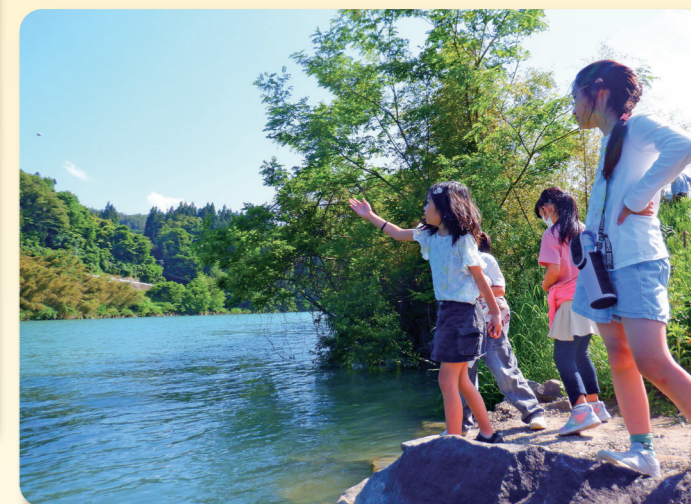
感じる ～川の流れ、木々の緑、そよぐ風～