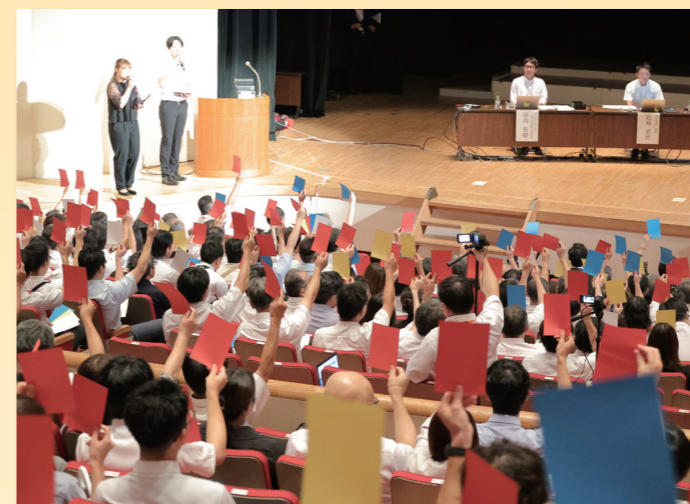
第139回総集会 佐久大会